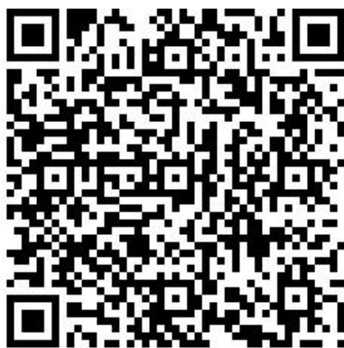
(河池学院缴费二维码)